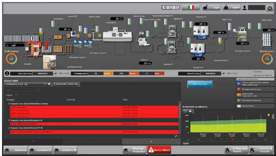
1. Schermata di Movicon.NEXt con la rappresentazione grafica della linea Tanica

Successivamente il marcatore stampa il lotto di produzione sul contenitore e la telecamera verifica che il codice sia stampato correttamente. A questo punto l'etichettatrice applica l'etichetta di prodotto su due lati del flacone e a questo punto vengono riempiti i flaconi dell'olio attraverso la filling machine. Il tappatore avvita il tappo sulle taniche e appone il sigillo di garanzia mentre la bilancia controlla il peso finale