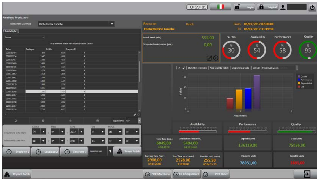
3. Visualizzazione dei principali indicatori chiave KPI

comunicazione continua con il PLC “concentratore”, storicizza gran parte di questi dati attraverso il Datalogger, memorizzandoli su un database SQL. I dati memorizzati sono: